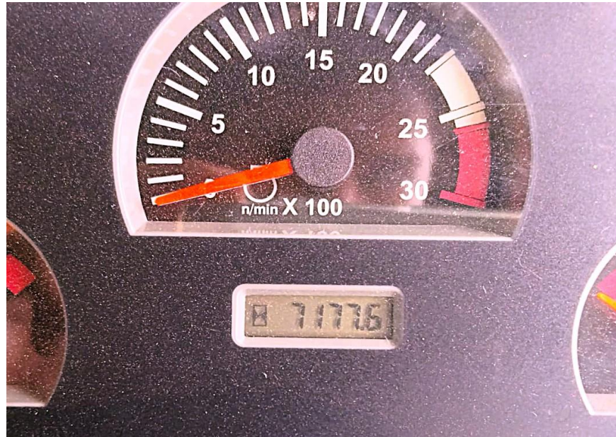
Fotografía No. 5 Vista Horómetro