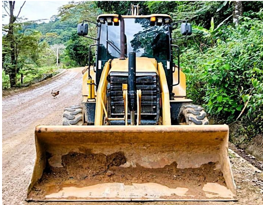
Fotografía No. 1 Vista Frontal