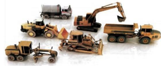
Fotografía No. 2 Vista Posterior