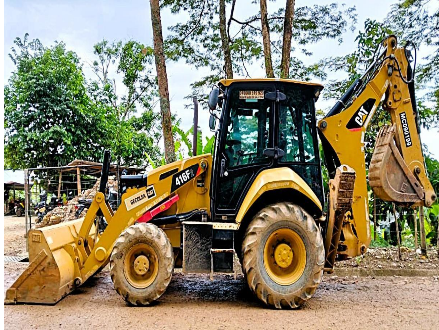
Fotografía No. 3 Vista Lateral