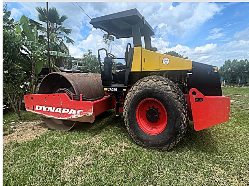
Fotografía No. 1 Vista Lateral