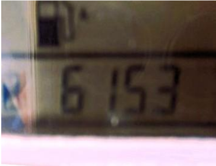
Fotografía No. 5 Vista Horómetro