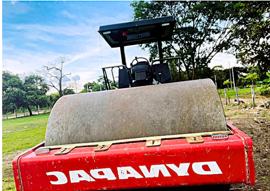
Fotografía No. 3 Vista Frontal