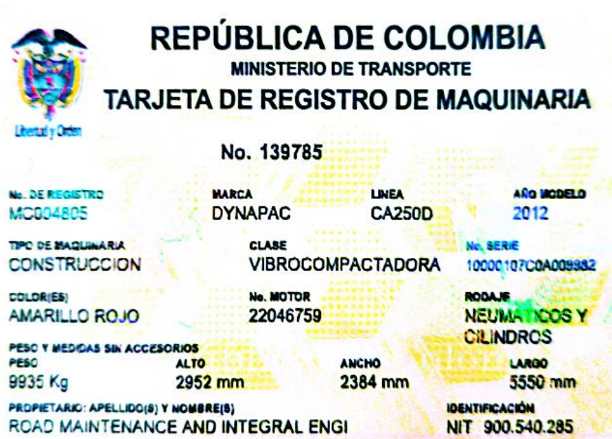
Fotografía No. 6 Vista Tarjeta de Propiedad

TRACTOINVERSIONES Cra. 31 No. 19-05 – Cel: 320 4863459 – 312 3753444 Web: www.tractoinversiones.com Email: tractoinversionesmaquinaria@gmail.com – Yopal