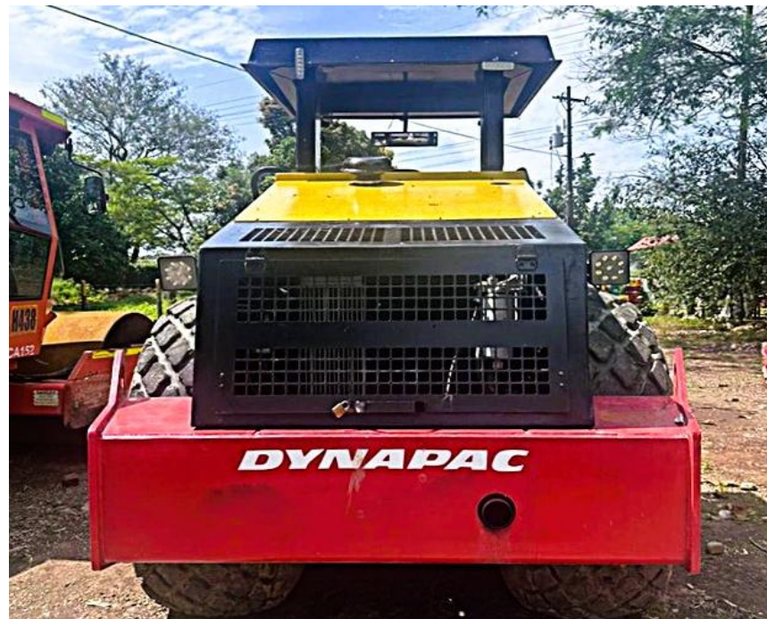
Fotografía No. 2 Vista Posterior

TRACTOINVERSIONES Cra. 31 No. 19-05 – Cel: 320 4863459 – 312 3753444 Web: www.tractoinversiones.com Email: tractoinversionesmaquinaria@gmail.com – Yopal