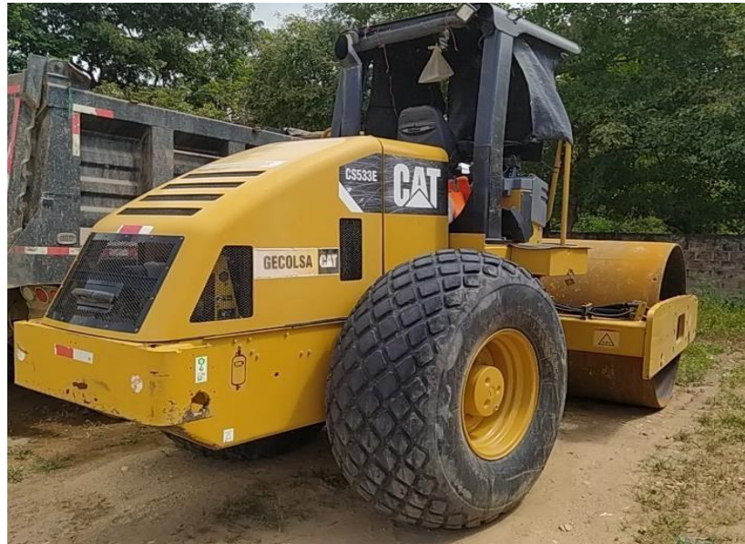
Fotografía No. 1 Vista Lateral