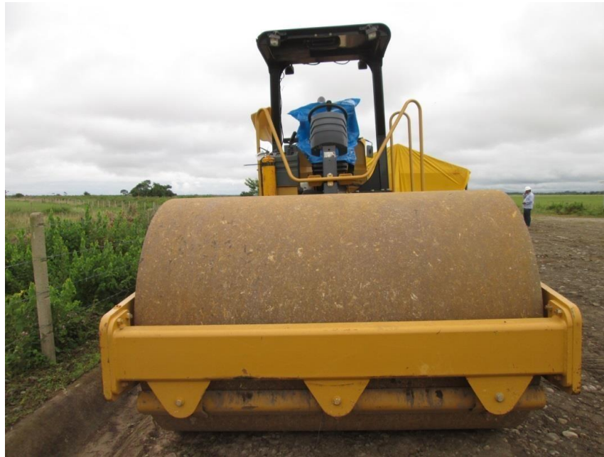
Fotografía No. 3 Vista Frontal