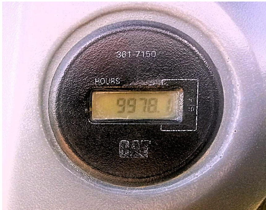
Fotografía No. 5 Horómetro