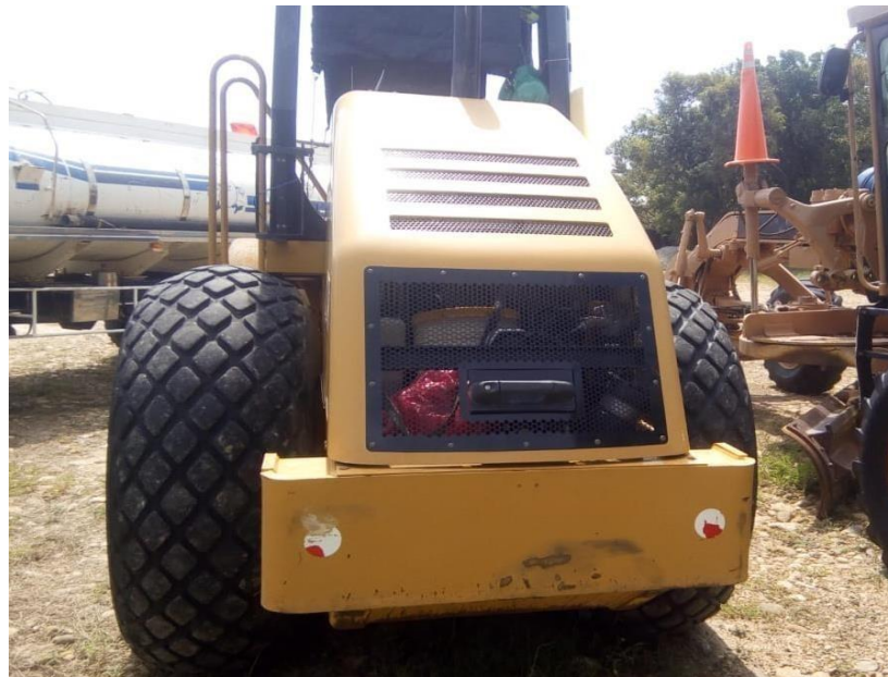
Fotografía No. 2 Vista Posterior

TRACTOINVERSIONES Calle 37 No. 19-15 Aerocivil – Cel: 320 4863459 – 312 3753444 Web: www.tractoinversiones.com/2025 Email: tractoinversionesmaquinaria@gmail.com – Yopal