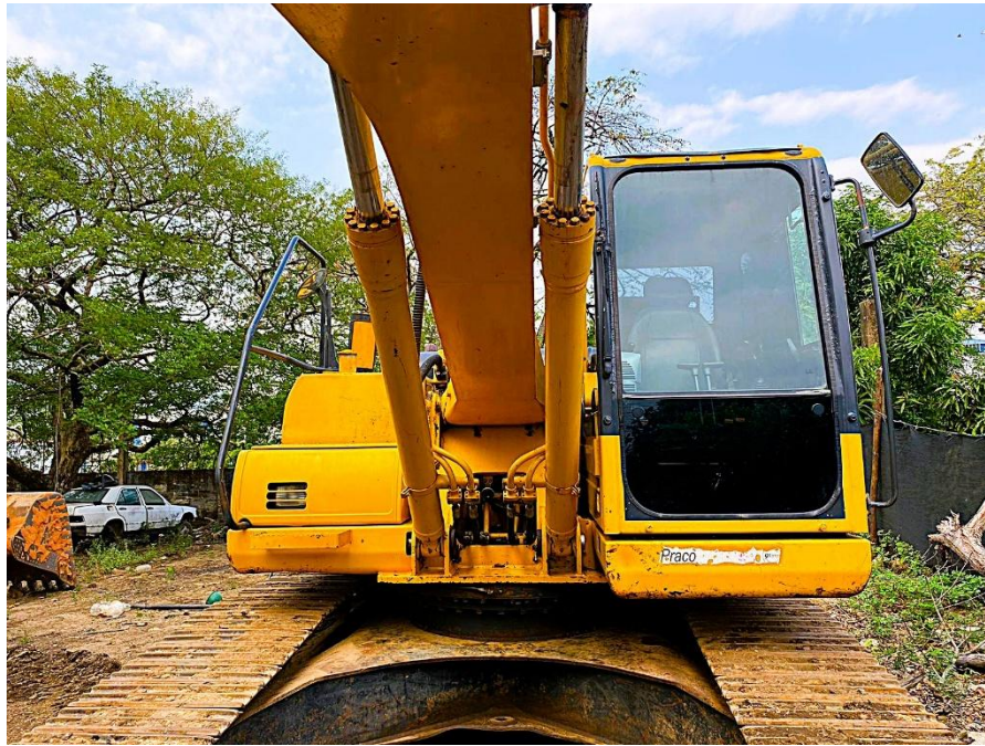
Fotografía No. 1 Vista Frontal