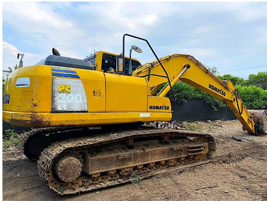
Fotografía No. 3 Vista Lateral