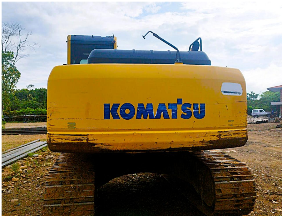
Fotografía No. 2 Vista Posterior

TRACTOINVERSIONES Calle 37 No. 19-15 Aerocivil – Cel: 320 4863459 – 312 3753444 Web: www.tractoinversiones.com Email: tractoinversionesmaquinaria@gmail.com – Yopal