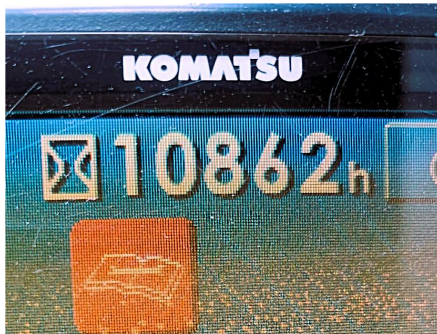
Fotografía No. 4 Horómetro

TRACTOINVERSIONES Calle 37 No. 19-15 Aerocivil – Cel: 320 4863459 – 312 3753444 Web: www.tractoinversiones.com Email: tractoinversionesmaquinaria@gmail.com – Yopal