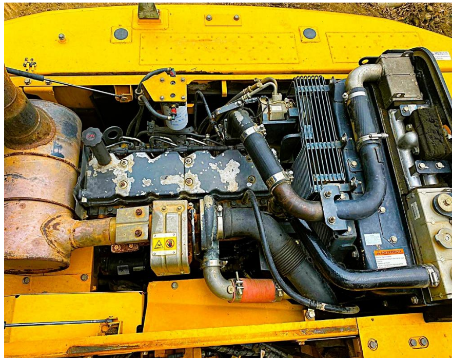
Fotografía No. 6 Vista Motor

TRACTOINVERSIONES Calle 37 No. 19-15 Aerocivil – Cel: 320 4863459 – 312 3753444 Web: www.tractoinversiones.com Email: tractoinversionesmaquinaria@gmail.com – Yopal