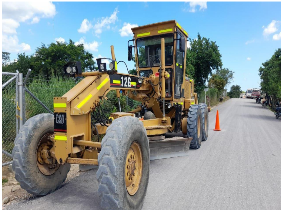
Fotografía No. 1 Vista Frontal