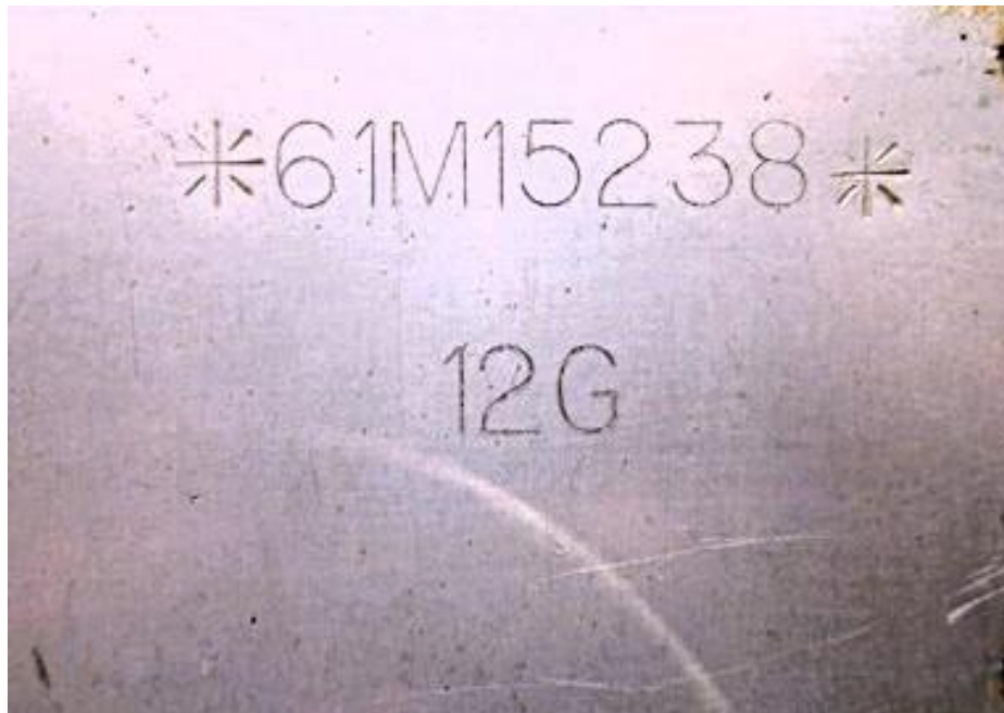
Fotografía No. 5 Vista Placa de Identificación