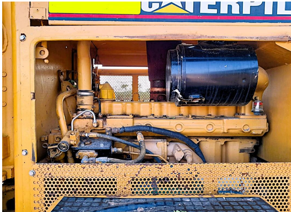
Fotografía No. 6 Vista Motor

TRACTOINVERSIONES Calle 37 No. 19-15 Aerocivil – Cel: 320 4863459 – 312 3753444 Web: www.tractoinversiones.com Email: tractoinversionesmaquinaria@gmail.com – Yopal