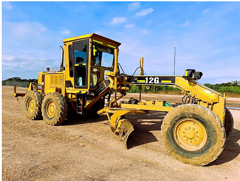
Fotografía No. 3 Vista Lateral