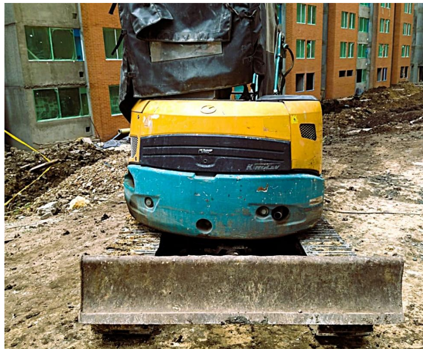
Fotografía No. 2 Vista Posterior

TRACTOINVERSIONES Calle 37 no. 19-15 Aerocivil – Cel: 320 4863459 – 312 3753444 Web: www.tractoinversiones.com Email: tractoinversionesmaquinaria@gmail.com – Yopal