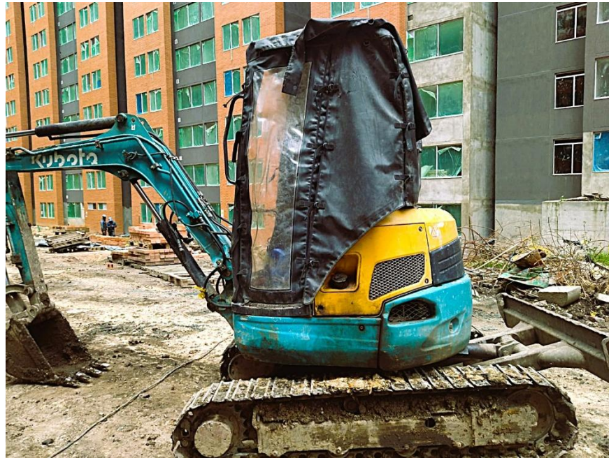
Fotografía No. 3 Vista Lateral