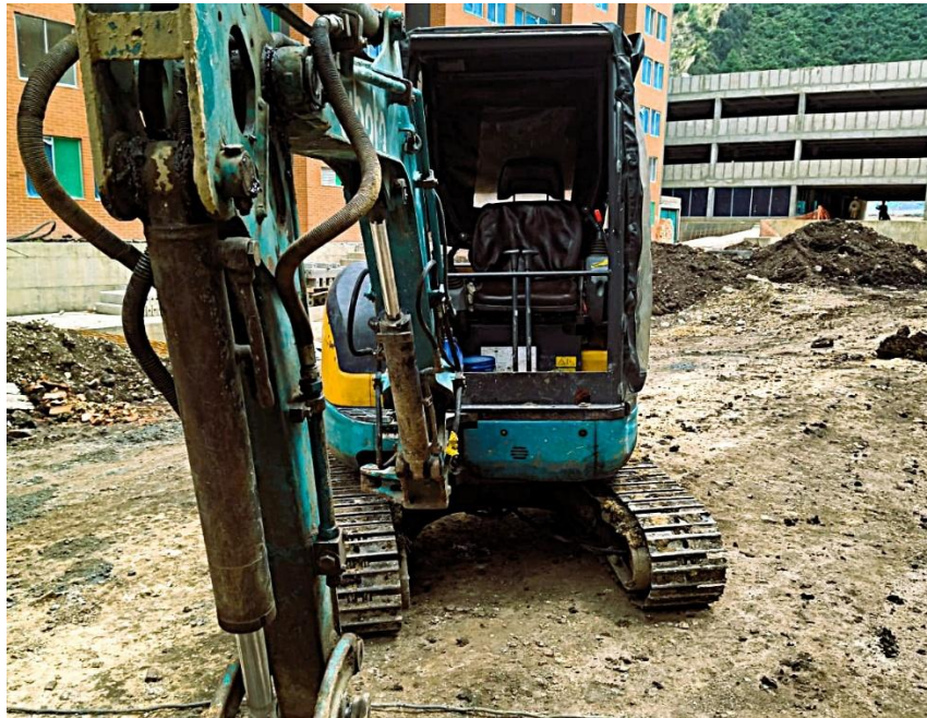
Fotografía No. 1 Vista Frontal