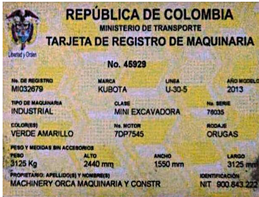
Fotografía No. 6 Vista Tarjeta de Propiedad

TRACTOINVERSIONES Calle 37 no. 19-15 Aerocivil – Cel: 320 4863459 – 312 3753444 Web: www.tractoinversiones.com Email: tractoinversionesmaquinaria@gmail.com – Yopal