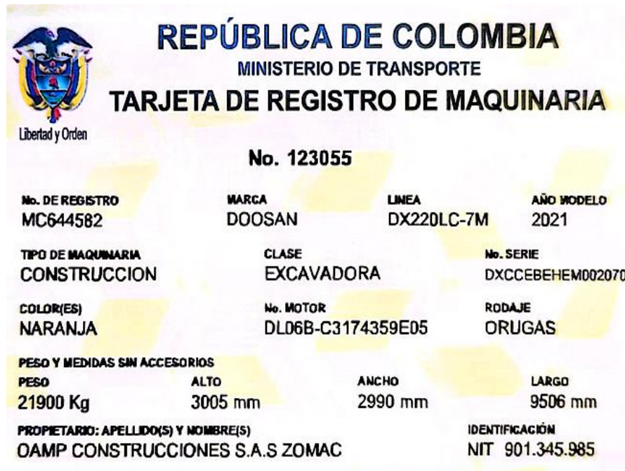
Fotografía No. 6 Vista Tarjeta de Propiedad

TRACTOINVERSIONES Calle 37 no. 19-15 Aerocivil – Cel: 320 4863459 – 312 3753444 Web: www.tractoinversiones.com Email: tractoinversionesmaquinaria@gmail.com – Yopal