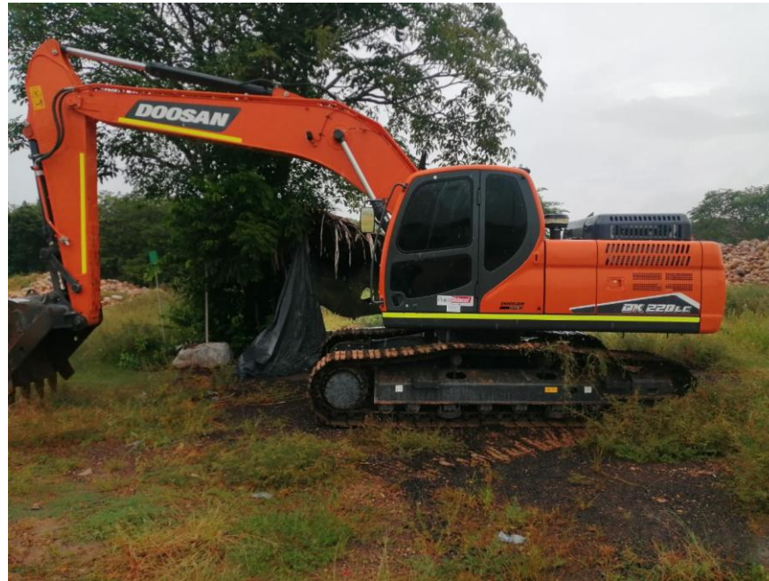
Fotografía No. 3 Vista Lateral