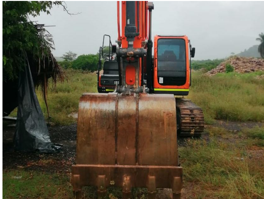
Fotografía No. 1 Vista Frontal