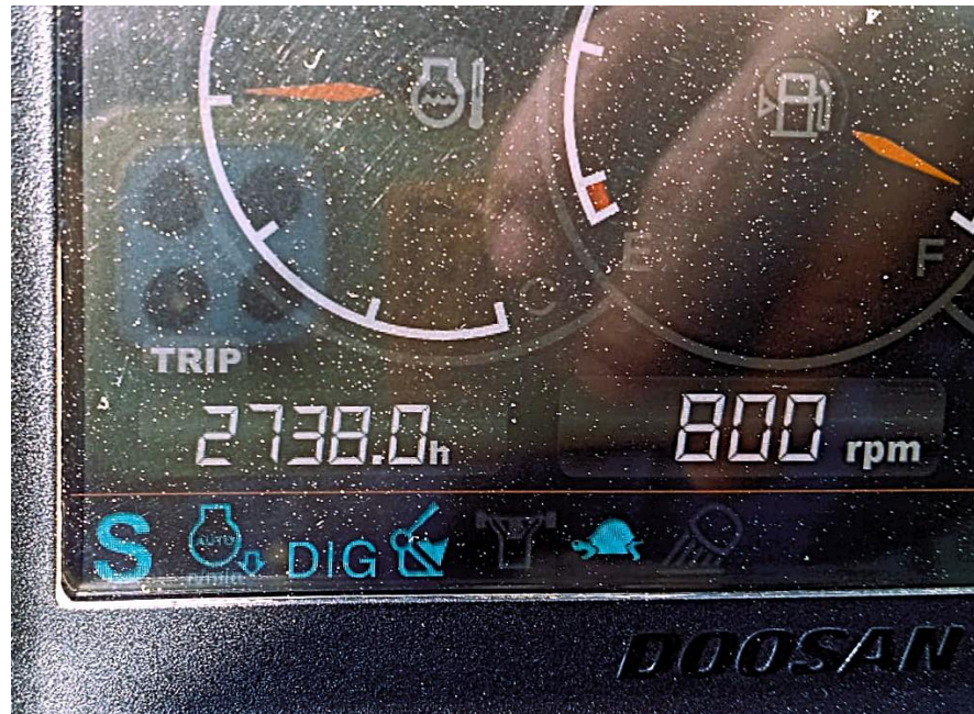
Fotografía No. 5 Vista Horómetro