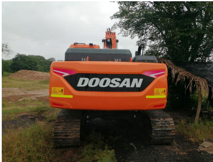
Fotografía No. 2 Vista Posterior

TRACTOINVERSIONES Calle 37 no. 19-15 Aerocivil – Cel: 320 4863459 – 312 3753444 Web: www.tractoinversiones.com Email: tractoinversionesmaquinaria@gmail.com – Yopal