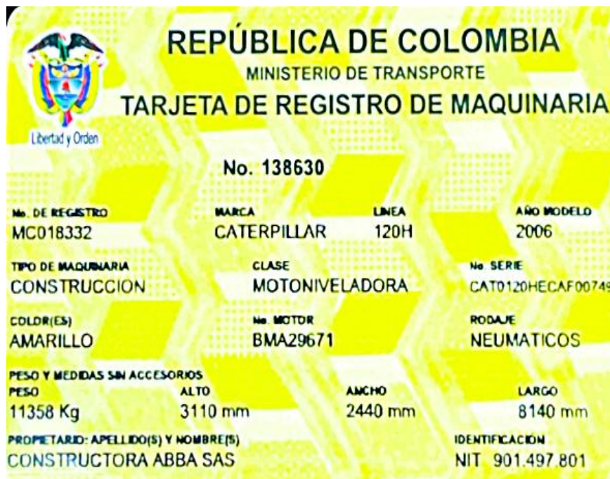
Fotografía No. 6 Vista Tarjeta de Propiedad