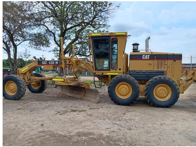
Fotografía No. 1 Vista Lateral