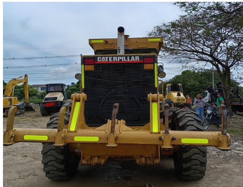
Fotografía No. 2 Vista Posterior

TRACTOINVERSIONES Calle 37 No. 19-15 Aerocivil – Cel: 320 4863459 – 312 3753444 Web: www.tractoinversiones.com Email: tractoinversionesmaquinaria@gmail.com – Yopal