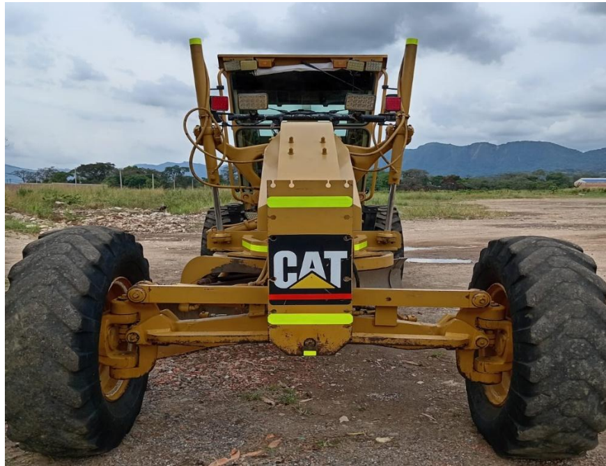
Fotografía No. 3 Vista Frontal