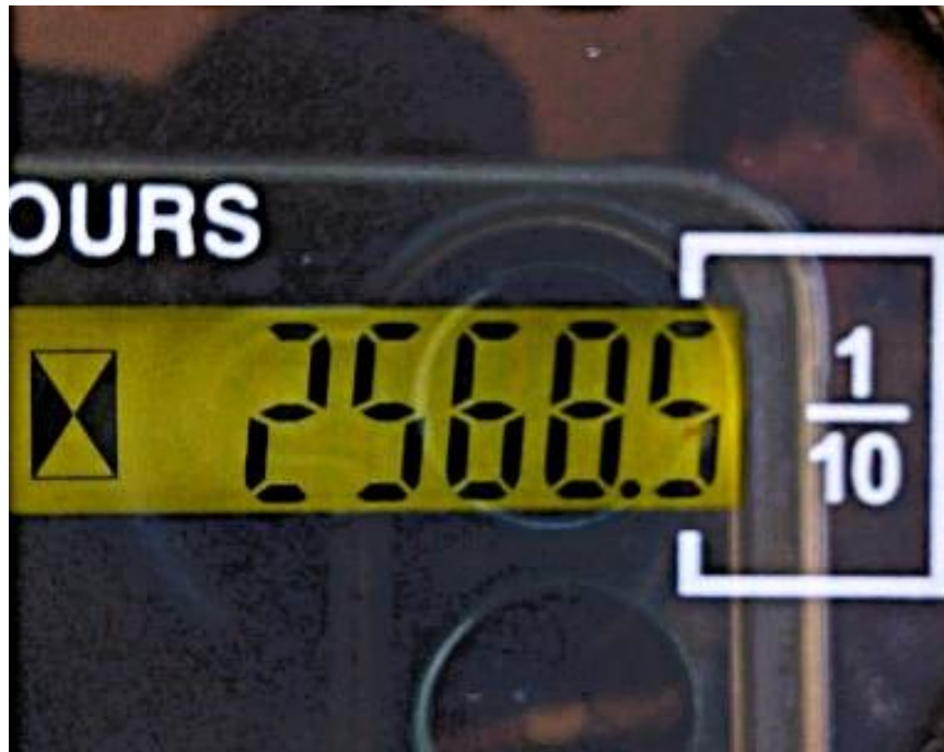
Fotografía No. 5 Horómetro