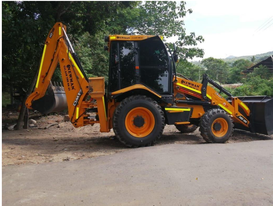
Fotografía No. 3 Vista Lateral