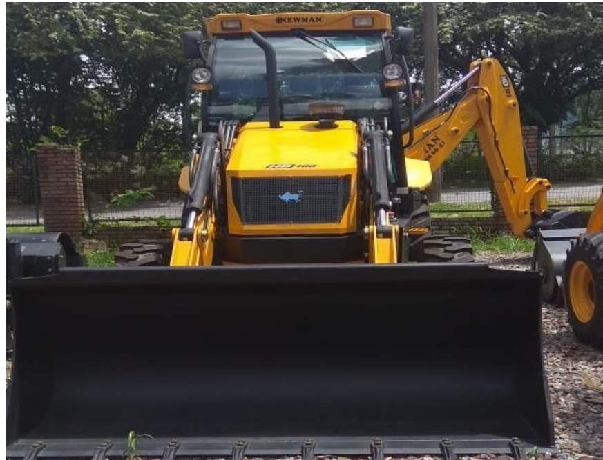
Fotografía No. 1 Vista Frontal