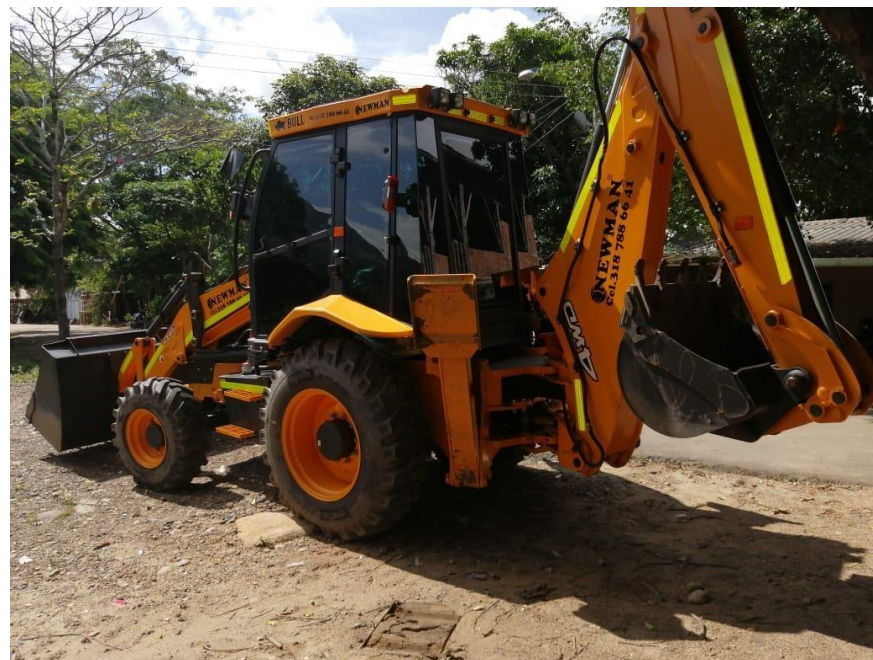
Fotografía No. 2 Vista Posterior

TRACTOINVERSIONES Calle 37 No. 19-15 Aerocivil – Cel: 320 4863459 – 312 3753444 Web: www.tractoinversiones.com Email: tractoinversionesmaquinaria@gmail.com – Yopal