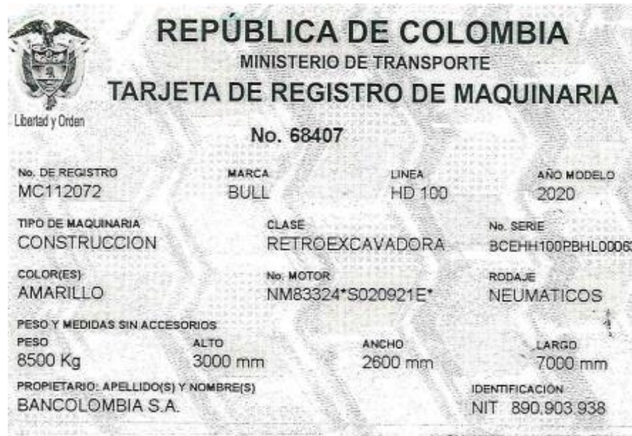
Fotografía No. 6 Vista Tarjeta de Propiedad

TRACTOINVERSIONES Calle 37 No. 19-15 Aerocivil – Cel: 320 4863459 – 312 3753444 Web: www.tractoinversiones.com Email: tractoinversionesmaquinaria@gmail.com – Yopal