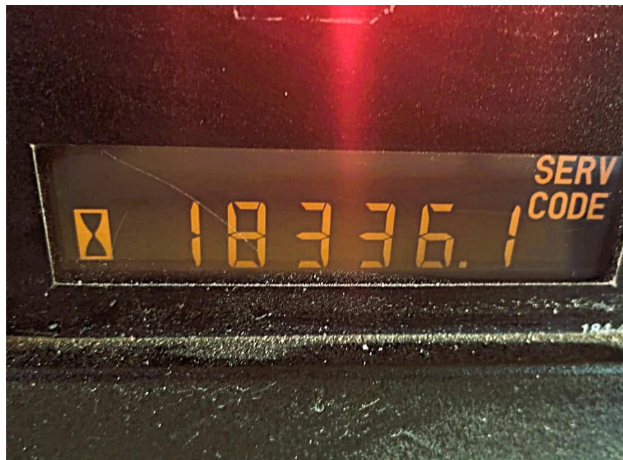
Fotografía No. 4 Horómetro

TRACTOINVERSIONES Calle 37 No. 19-15 Aerocivil – Cel: 320 4863459 – 312 3753444 Web: www.tractoinversiones.com Email: tractoinversionesmaquinaria@gmail.com – Yopal