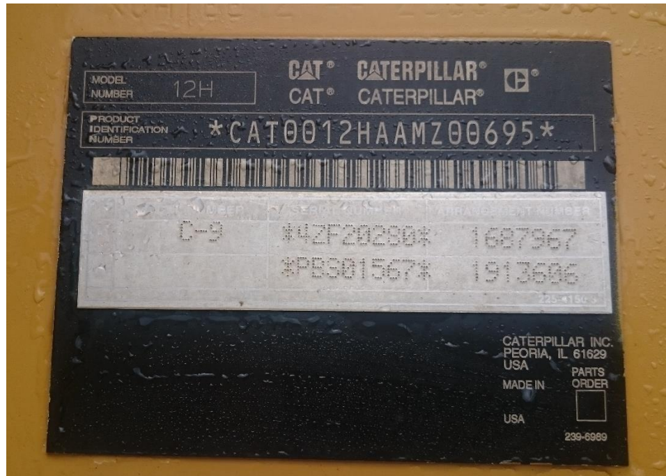
Fotografía No. 5 Vista Placa de Identificación