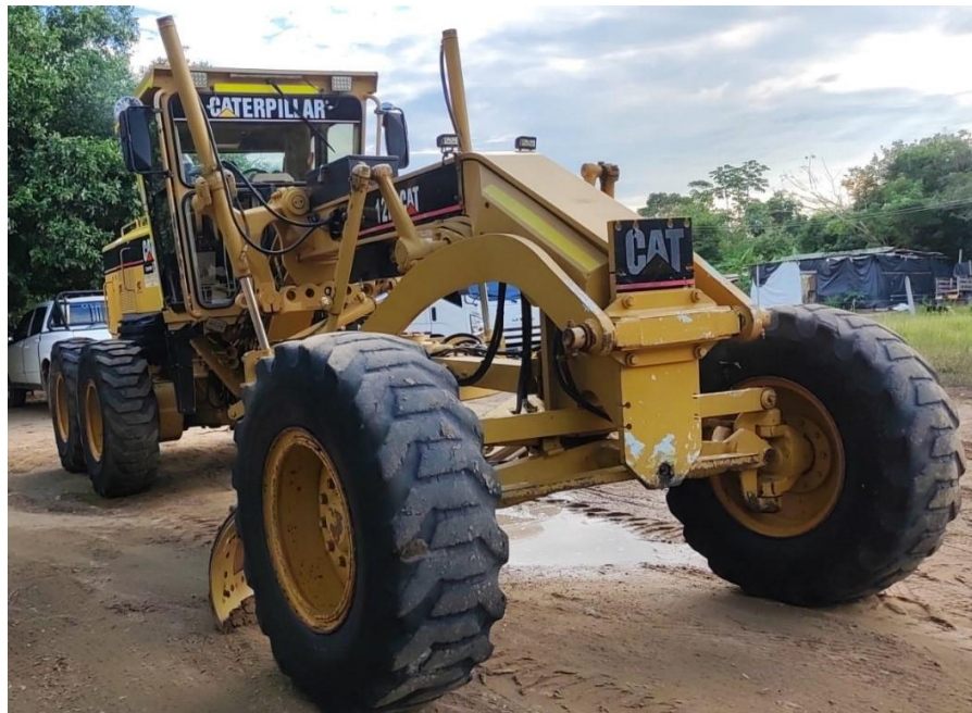
Fotografía No. 1 Vista Frontal