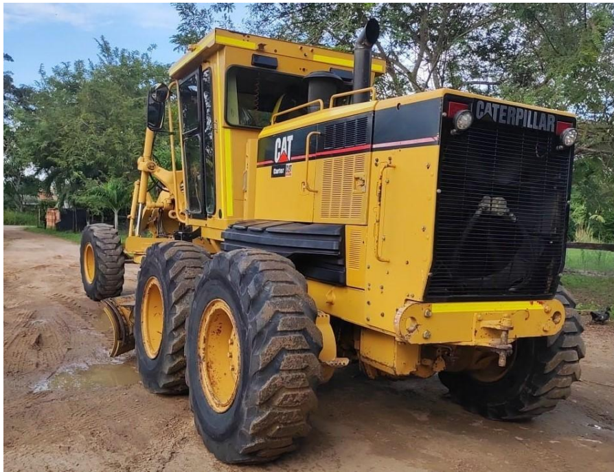
Fotografía No. 2 Vista Posterior

TRACTOINVERSIONES Calle 37 No. 19-15 Aerocivil – Cel: 320 4863459 – 312 3753444 Web: www.tractoinversiones.com Email: tractoinversionesmaquinaria@gmail.com – Yopal