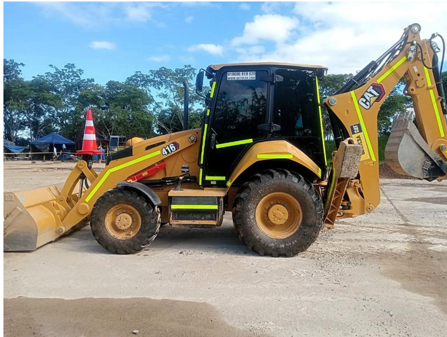
Fotografía No. 3 Vista Lateral