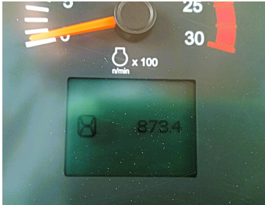
Fotografía No. 4 Horómetro

TRACTOINVERSIONES Calle 37 No. 19-15 Aerocivil – Cel: 320 4863459 – 312 3753444 Web: www.tractoinversiones.com Email: tractoinversionesmaquinaria@gmail.com – Yopal