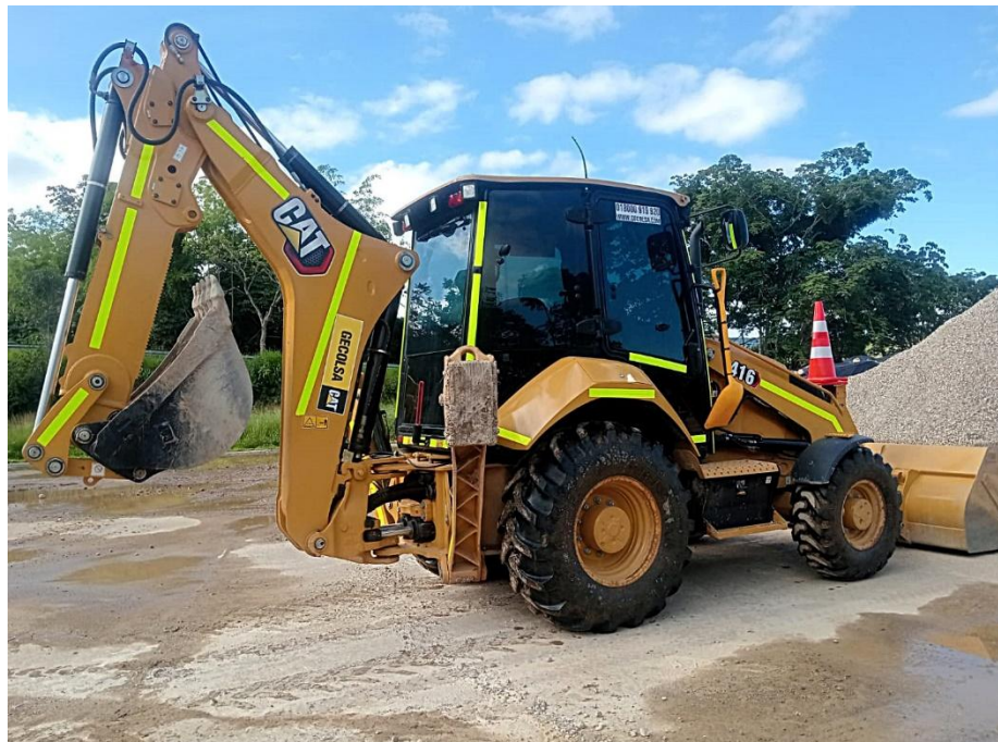
Fotografía No. 2 Vista Posterior

TRACTOINVERSIONES Calle 37 No. 19-15 Aerocivil – Cel: 320 4863459 – 312 3753444 Web: www.tractoinversiones.com Email: tractoinversionesmaquinaria@gmail.com – Yopal