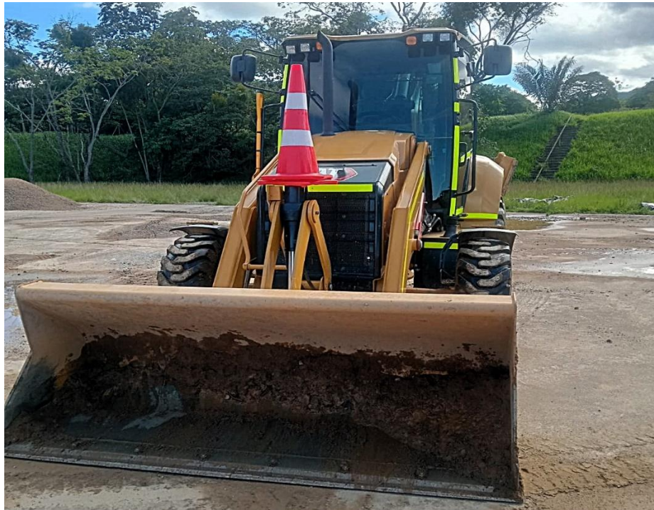
Fotografía No. 1 Vista Frontal