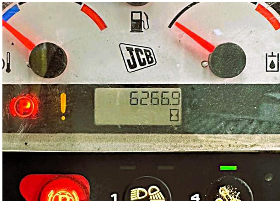
Fotografía No. 4 Horómetro

TRACTOINVERSIONES Calle 37 No. 19-15 Aerocivil – Cel: 320 4863459 – 312 3753444 Web: www.tractoinversiones.com Email: tractoinversionesmaquinaria@gmail.com – Yopal