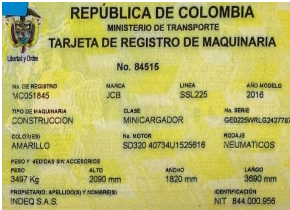
Fotografía No. 6 Tarjeta de Propiedad

TRACTOINVERSIONES Calle 37 No. 19-15 Aerocivil – Cel: 320 4863459 – 312 3753444 Web: www.tractoinversiones.com Email: tractoinversionesmaquinaria@gmail.com – Yopal