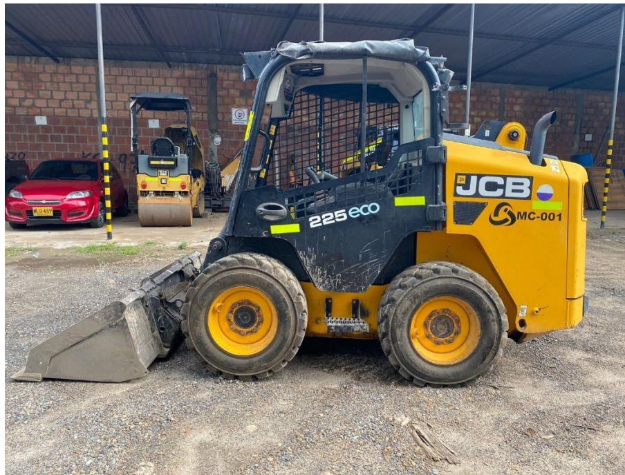
Fotografía No. 3 Vista Lateral