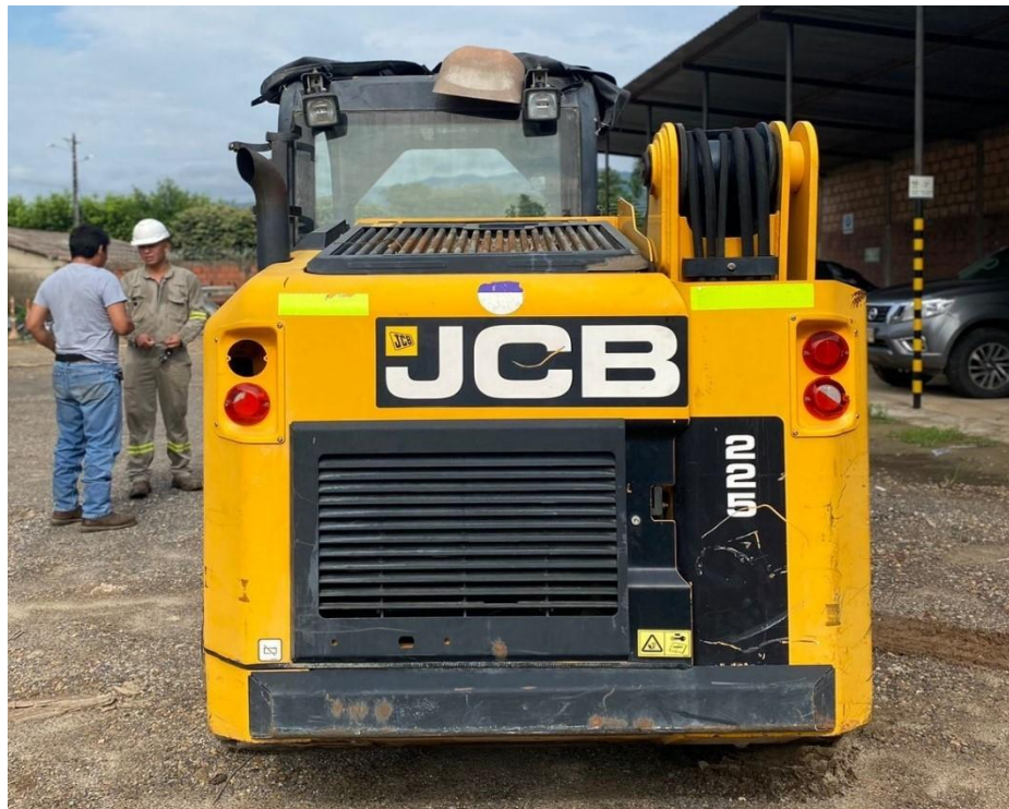
Fotografía No. 2 Vista Posterior

TRACTOINVERSIONES Calle 37 No. 19-15 Aerocivil – Cel: 320 4863459 – 312 3753444 Web: www.tractoinversiones.com Email: tractoinversionesmaquinaria@gmail.com – Yopal