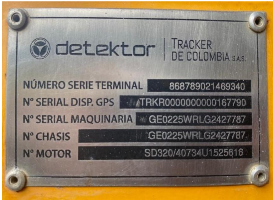
Fotografía No. 5 Placa de Identificación