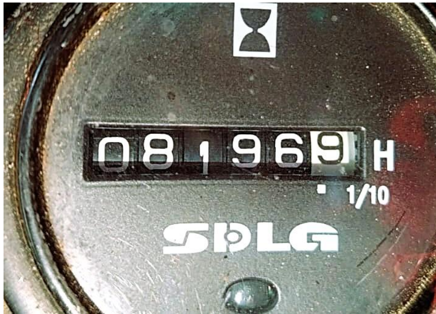
Fotografía No. 5 Horómetro