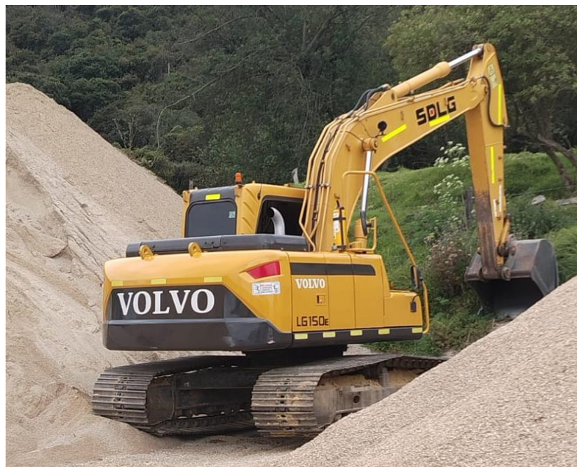
Fotografía No. 2 Vista Posterior

TRACTOINVERSIONES Calle 37 No. 19-15 – Cel: 320 4863459 – 312 3753444 Web: www.tractoinversiones.com Email: tractoinversionesmaquinaria@gmail.com/2025 – Yopal