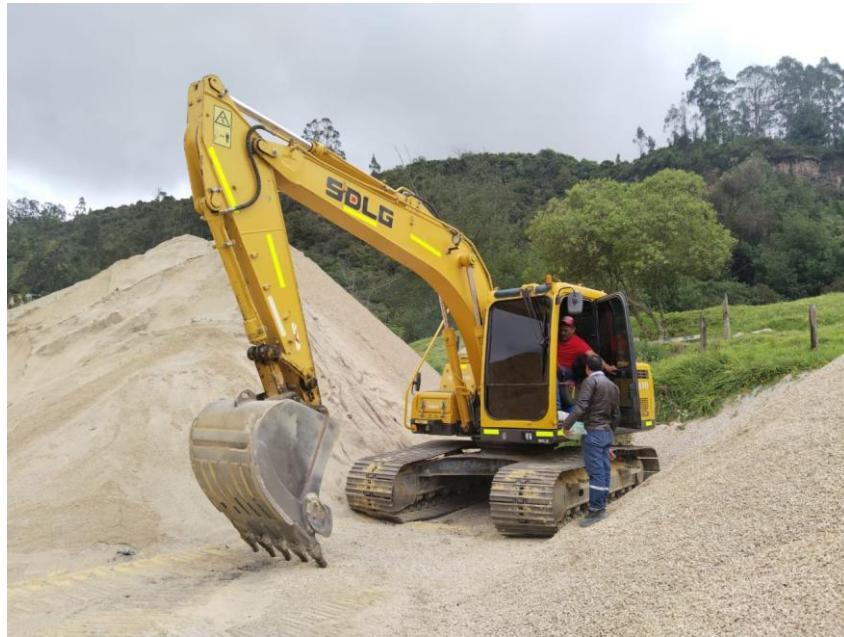
Fotografía No. 3 Vista Frontal