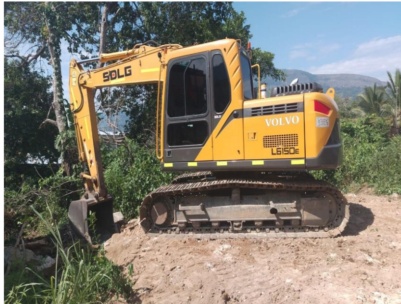
Fotografía No. 1 Vista Lateral