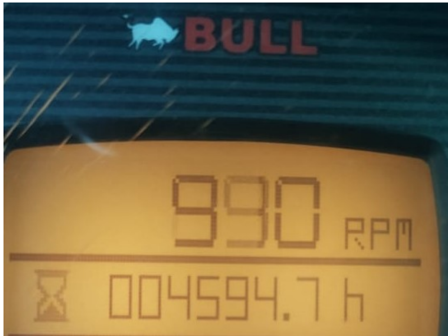
Fotografía No. 4 Horómetro

TRACTOINVERSIONES Calle 37 No. 19-15 Aerocivil – Cel: 320 4863459 – 312 3753444 Web: www.tractoinversiones.com Email: tractoinversionesmaquinaria@gmail.com – Yopal