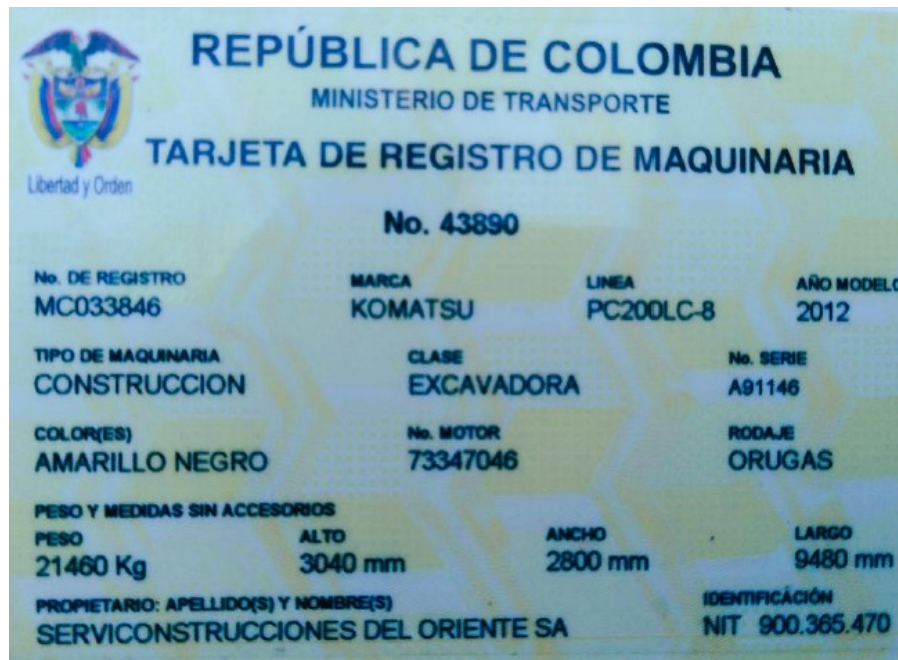
Fotografía No. 7 Vista Tarjeta de Propiedad

TRACTOINVERSIONES Calle 37 No. 19-15 Aerocivil – Cel: 320 4863459 – 312 3753444 Web: www.tractoinversiones.com Email: tractoinversionesmaquinaria@gmail.com – Yopal