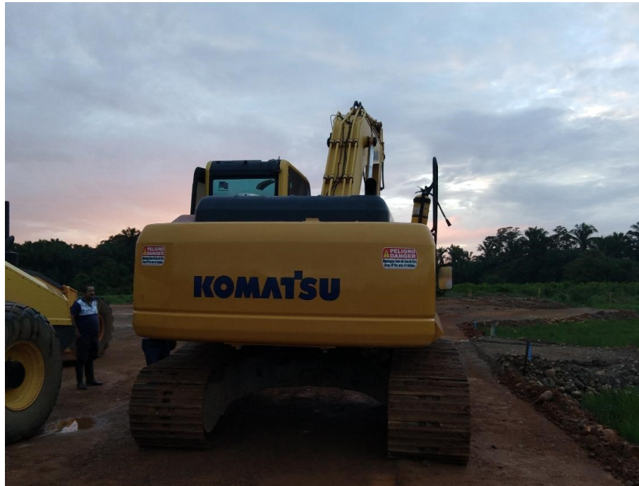
Fotografía No. 2 Vista Posterior

TRACTOINVERSIONES Calle 37 No. 19-15 Aerocivil – Cel: 320 4863459 – 312 3753444 Web: www.tractoinversiones.com Email: tractoinversionesmaquinaria@gmail.com – Yopal