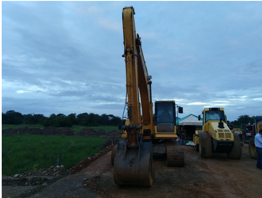
Fotografía No. 1 Vista Frontal