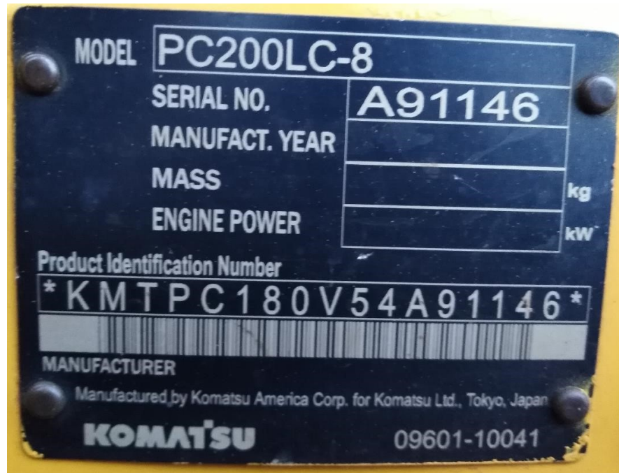
Fotografía No. 5 Vista Placa de Identificación