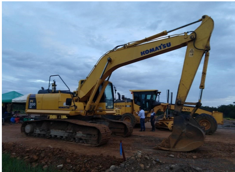
Fotografía No. 3 Vista Lateral