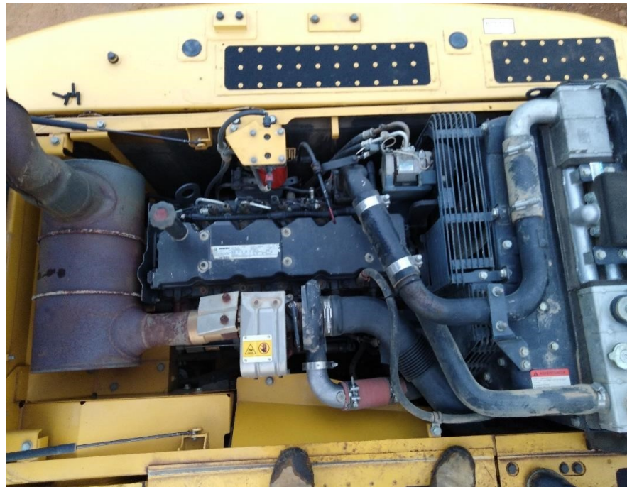
Fotografía No. 6 Vista Motor

TRACTOINVERSIONES Calle 37 No. 19-15 Aerocivil – Cel: 320 4863459 – 312 3753444 Web: www.tractoinversiones.com Email: tractoinversionesmaquinaria@gmail.com – Yopal