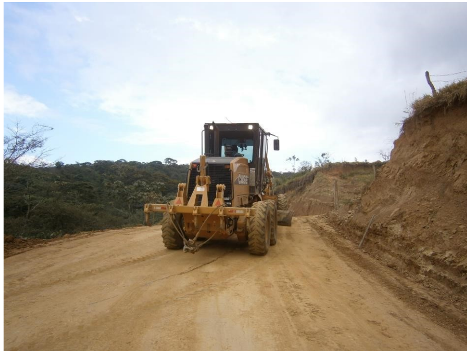
Fotografía No. 2 Vista Posterior

TRACTOINVERSIONES Cra. 14 Calle 30 Esquina Estación de Servicio Llanogas – Cel: 320 4863459 – 312 3753444 Web: www.tractoinversiones.com Email: tractoinversionesmaquinaria@gmail.com – Yopal