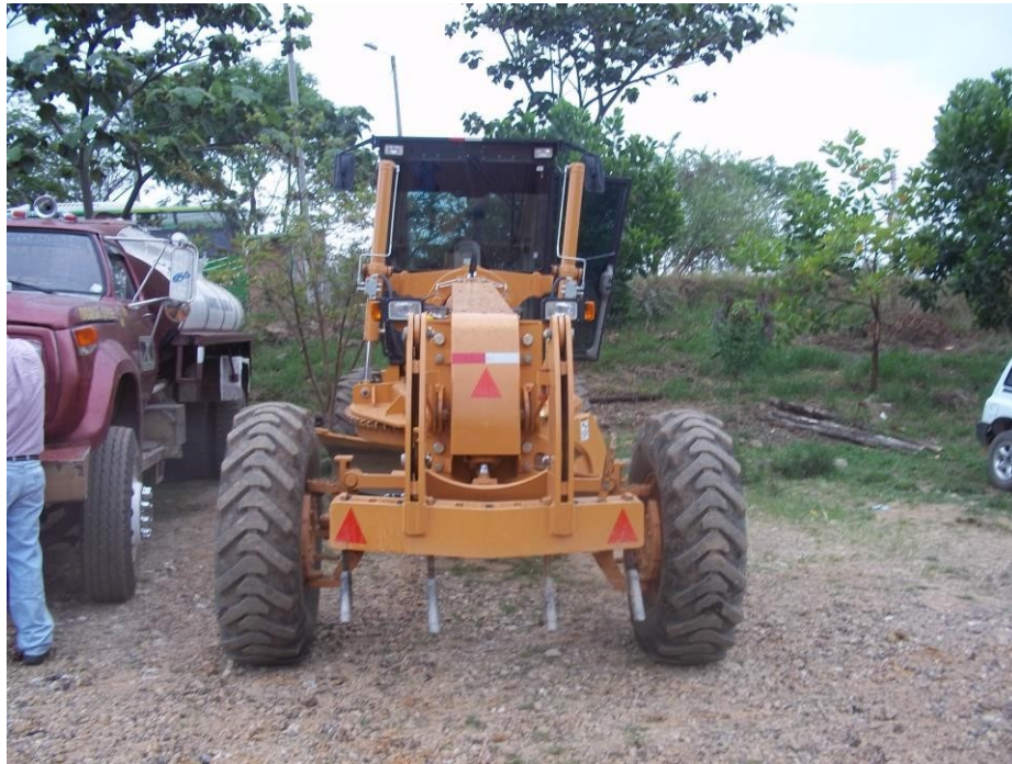
Fotografía No. 1 Vista Frontal