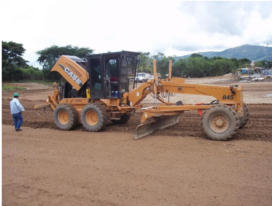
Fotografía No. 3 Vista Lateral