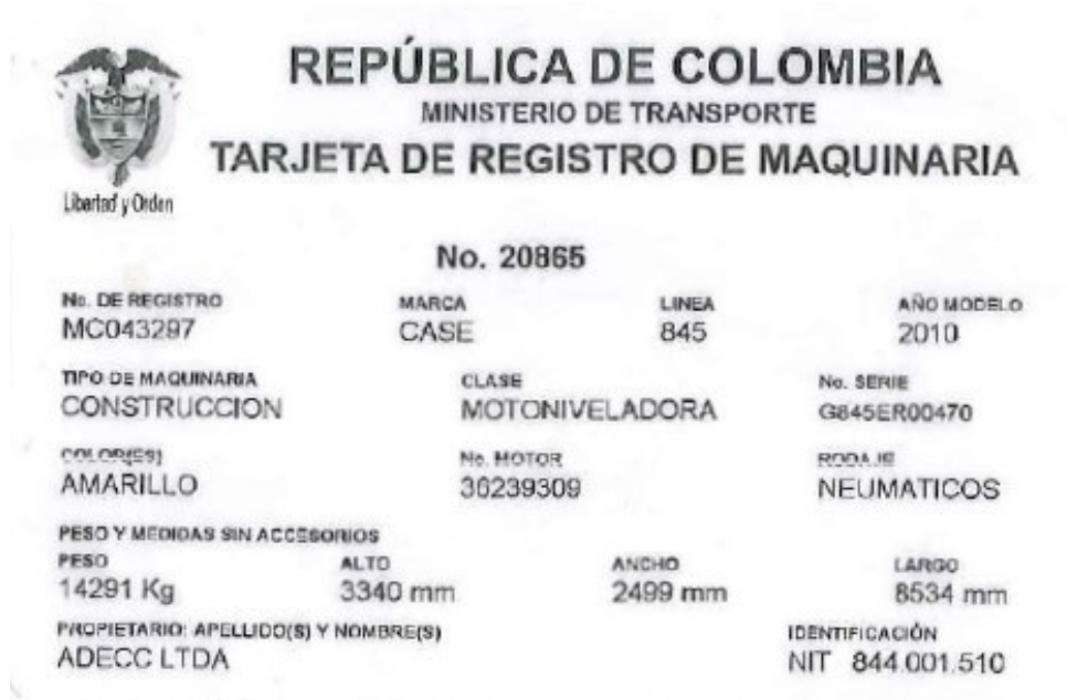
Fotografía No. 6 Vista Tarjeta de Propiedad

TRACTOINVERSIONES Cra. 14 Calle 30 Esquina Estación de Servicio Llanogas – Cel: 320 4863459 – 312 3753444 Web: www.tractoinversiones.com Email: tractoinversionesmaquinaria@gmail.com – Yopal