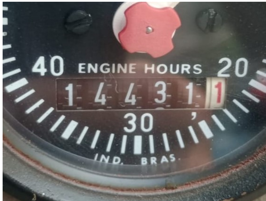
Fotografía No. 4 Horometro

TRACTOINVERSIONES Cra. 14 Calle 30 Esquina Estación de Servicio Llanogas – Cel: 320 4863459 – 312 3753444 Web: www.tractoinversiones.com Email: tractoinversionesmaquinaria@gmail.com – Yopal