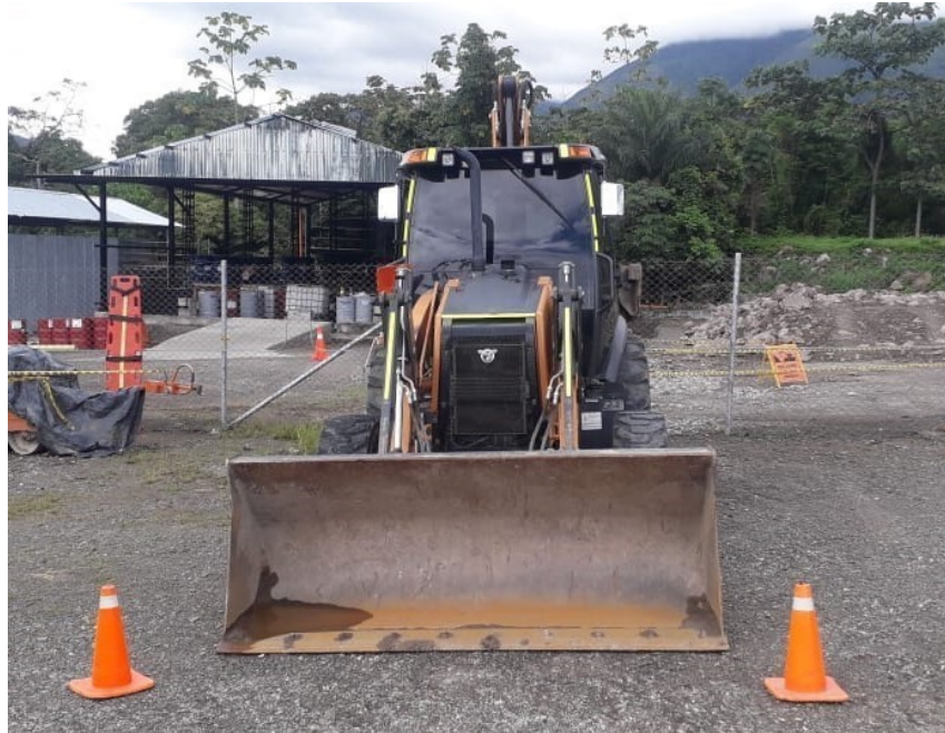
Fotografía No. 3 Vista Frontal