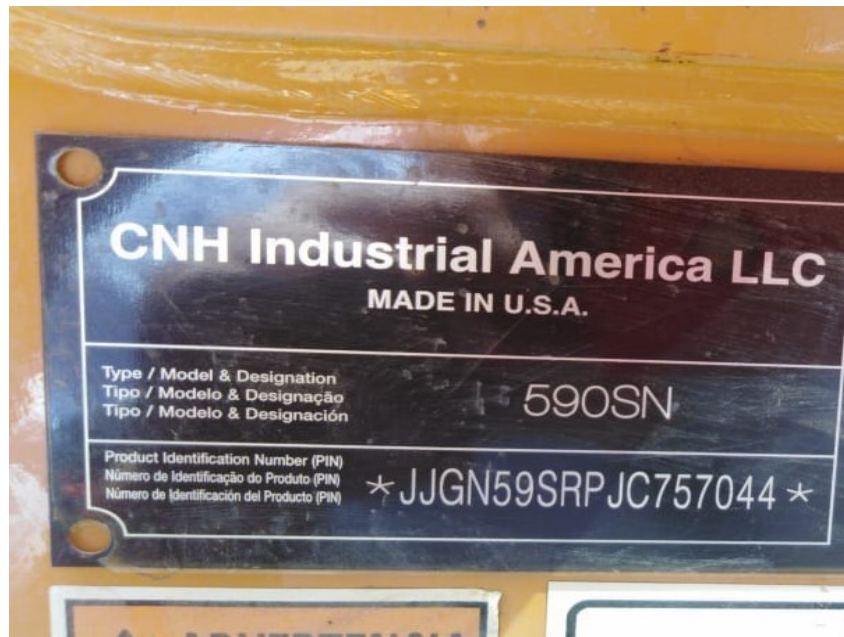
Fotografía No. 4 Vista Placa de Identificación

TRACTOINVERSIONES Cra. 31 No. 19-05 – Cel: 320 4863459 – 312 3753444 Web: www.tractoinversiones.com Email: tractoinversionesmaquinaria@gmail.com – Yopal