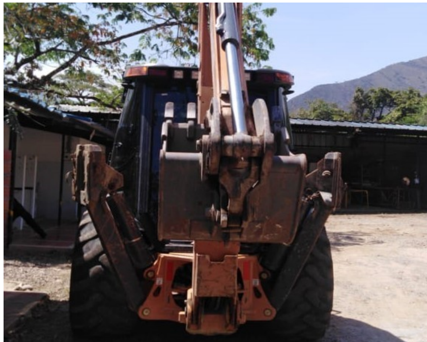
Fotografía No. 2 Vista Posterior

TRACTOINVERSIONES Cra. 31 No. 19-05 – Cel: 320 4863459 – 312 3753444 Web: www.tractoinversiones.com Email: tractoinversionesmaquinaria@gmail.com – Yopal