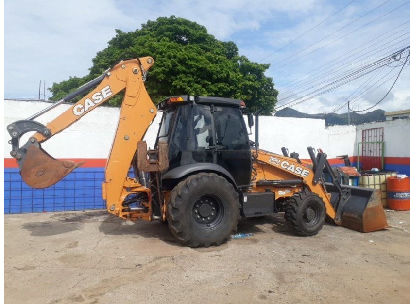
Fotografía No. 1 Vista Lateral