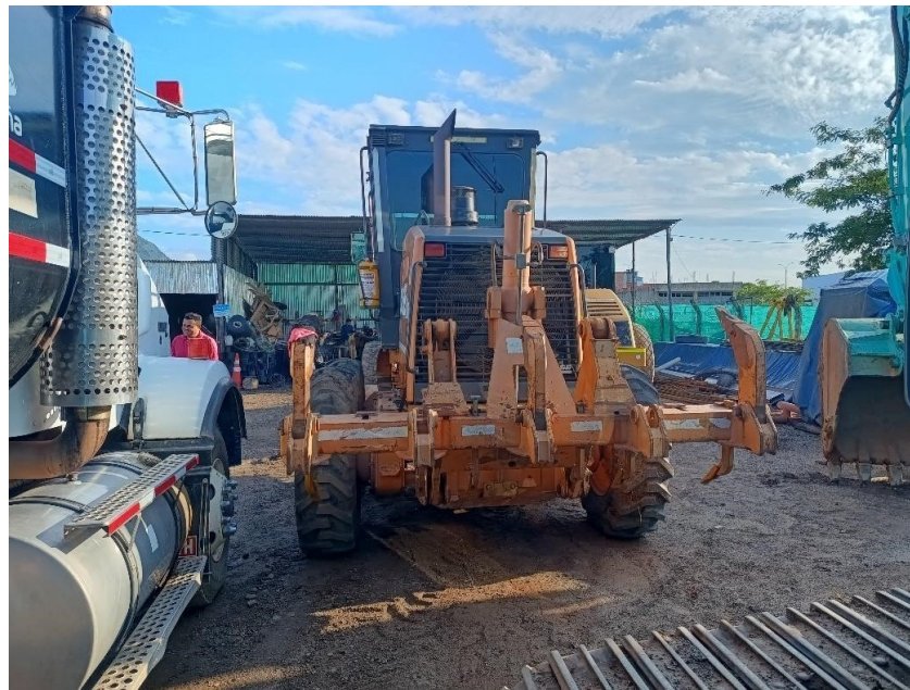
Fotografía No. 2 Vista Posterior

TRACTOINVERSIONES Cra. 14 Calle 30 Esquina Estación de Servicio Llanogas – Cel: 320 4863459 – 312 3753444 Web: www.tractoinversiones.com Email: tractoinversionesmaquinaria@gmail.com – Yopal