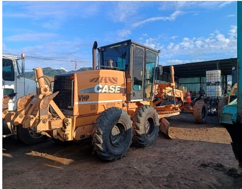
Fotografía No. 3 Vista Lateral