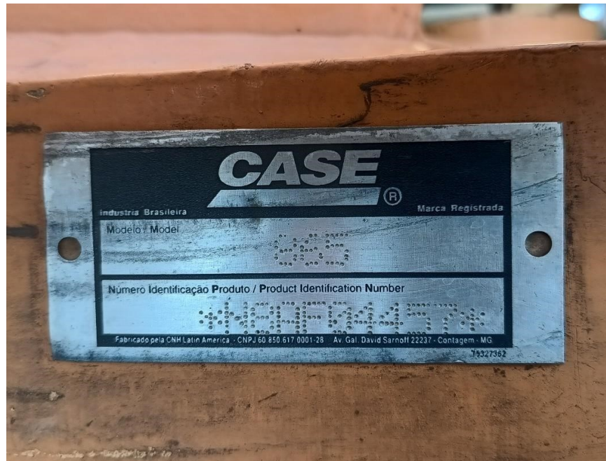
Fotografía No. 5 Vista Placa de Identificación

TRACTOINVERSIONES Cra. 14 Calle 30 Esquina Estación de Servicio Llanogas – Cel: 320 4863459 – 312 3753444 Web: www.tractoinversiones.com Email: tractoinversionesmaquinaria@gmail.com – Yopal