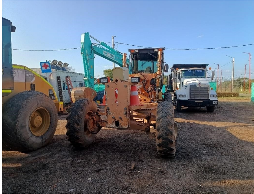
Fotografía No. 1 Vista Frontal