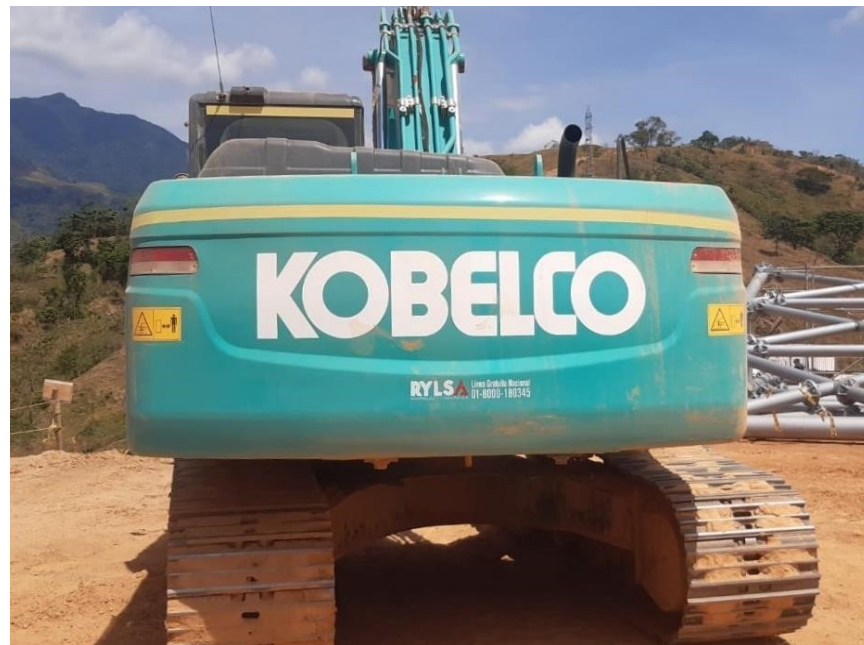
Fotografía No. 2 Vista Posterior

Cra. 14 Calle 30 Esquina Estación de Servicio Llanogas – Cel: 320 4863459 – 312 3753444 Web: www.tractoinversiones.com Email: tractoinversionesmaquinaria@gmail.com – Yopal