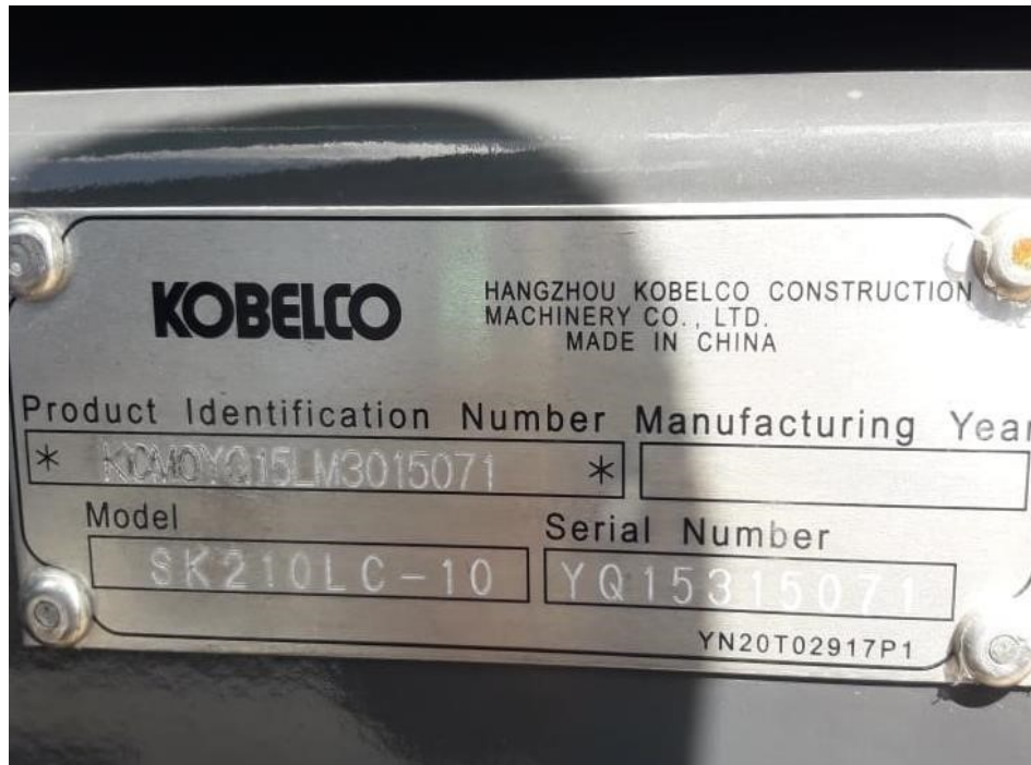
Fotografía No. 5 Vista Placa de Identificación