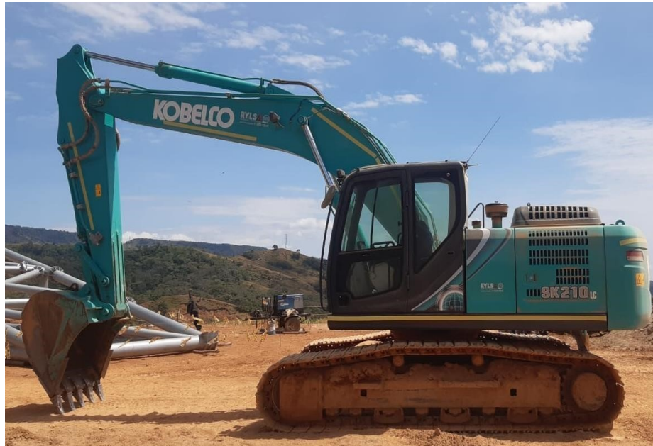
Fotografía No. 3 Vista Lateral