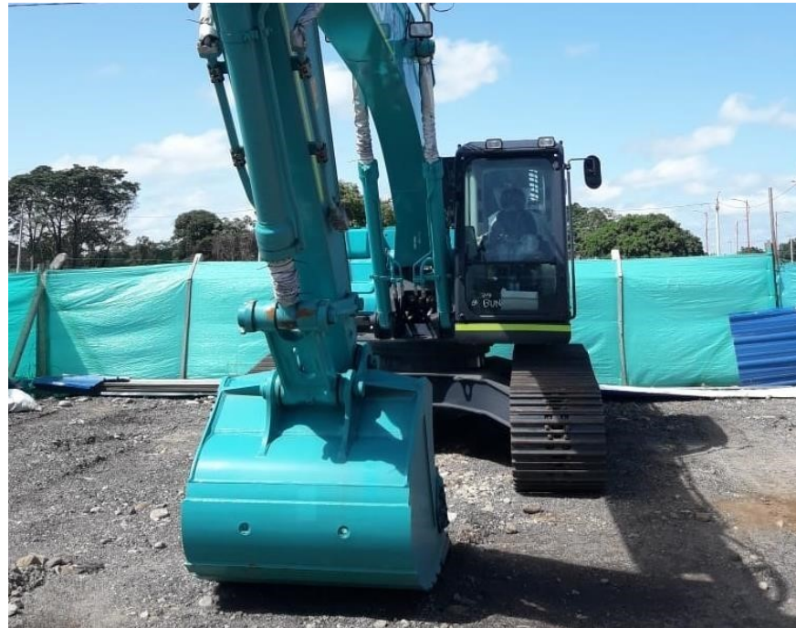
Fotografía No. 1 Vista Frontal